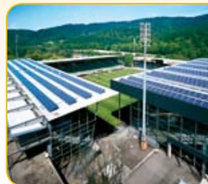
Die Solaranlage auf dem Freiburger badenova-Stadion