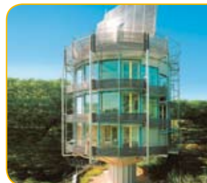
Das rotierende Solarhaus „Heliotrop“