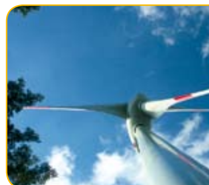
Die Nutzung von Windenergie im Schwarzwald

Anmeldung unter: www.local-renewables2007.org